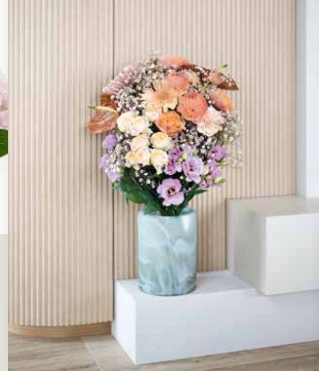
Zachte pasteltinten voor zowel de ruimte als voor het boeket.

De bloemarrangementen in deze trend worden gebruikt om een ruimte te verzachten en een dromerige uitstraling te creëren. Vaak worden arrangementen geplaatst in hoeken of op een punt waar de muur in de vloer overgaat of waar een kast de muur raakt. Dit om de overgang, de naad tussen het ene en het andere object, te verzachten. Arrangementen zijn wolkig en zijn aan de uiteinden vaak transparant. Droog en vers materiaal wordt in combinatie met elkaar gebruikt. Er zijn ook boeketten die een volumineuze, zachte en dromerige uitstraling hebben of enkele bloemen die zachtheid brengen door middel van hun vorm of door zacht overlopende kleuren. Voor planten zal ook het transparante karakter en zacht blad, in kleur en textuur, belangrijk zijn. Voor de tuin worden zachte pluimige grassen afgewisseld met compactere beplanting. Voor bloeiende planten geldt dat de kleuren zowel als de bloemvormen zacht zijn.