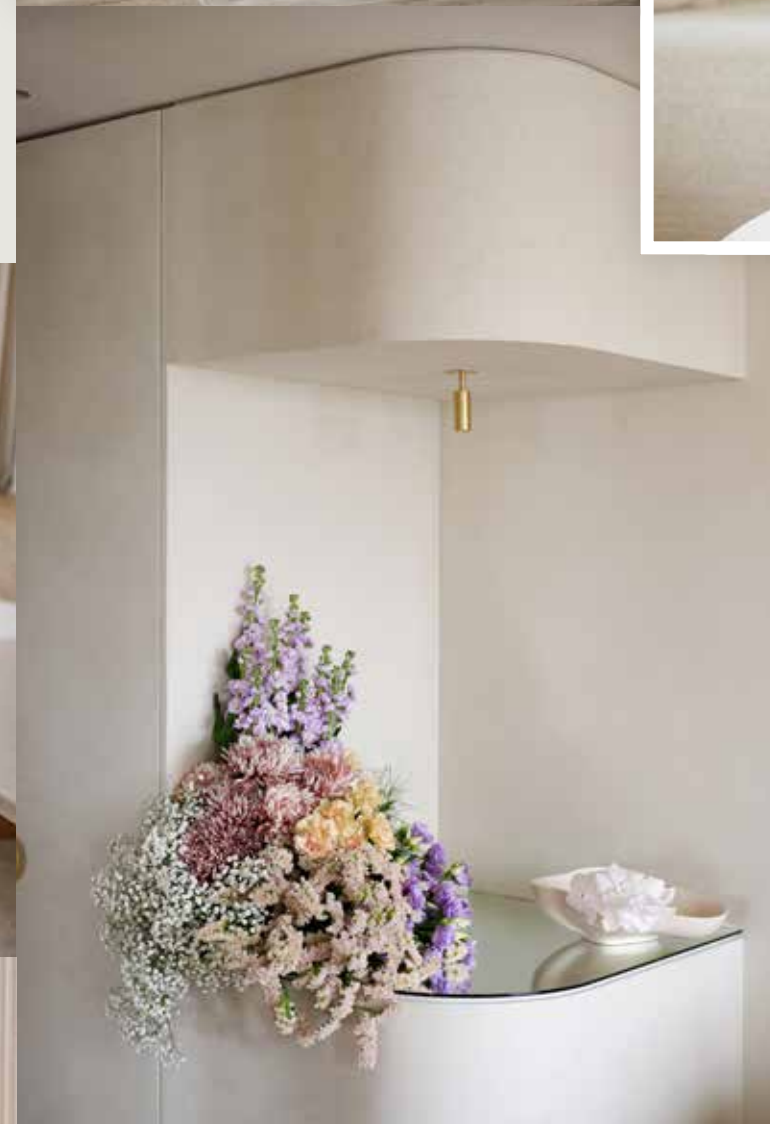
Arrangementen die als een zachte wolk de harde randen in de ruimte bedekken.