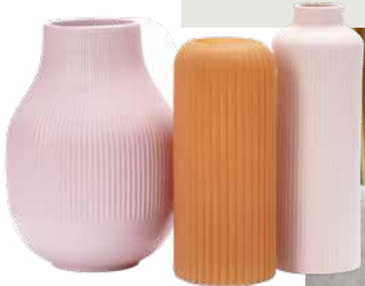
Zachte afgeronde vormen voor de vazen en het bloemwerk.