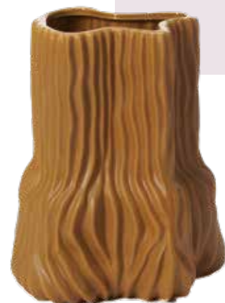
Organische vorm, opvallend en toch vanzelfsprekend.