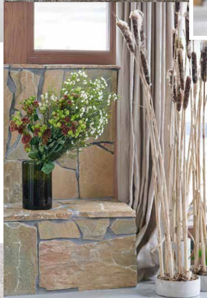
Boeketten lijken soms nauwelijks te zijn vormgegeven.