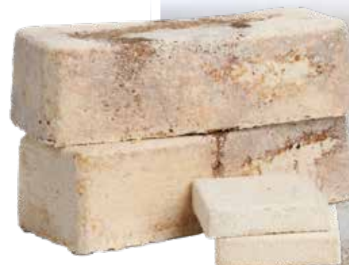
Nieuwe organische materialen zoals mycelium.