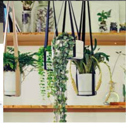
Unregelmäßige Formen und Muster