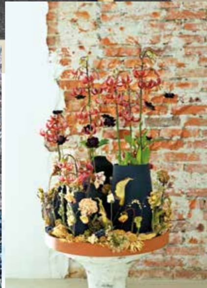
Getrocknete Blumen sind zurück