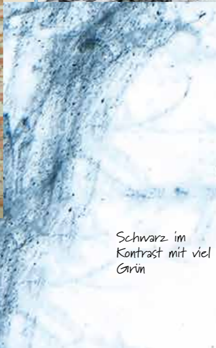
Schwarz im Kontrast mit viel Grün