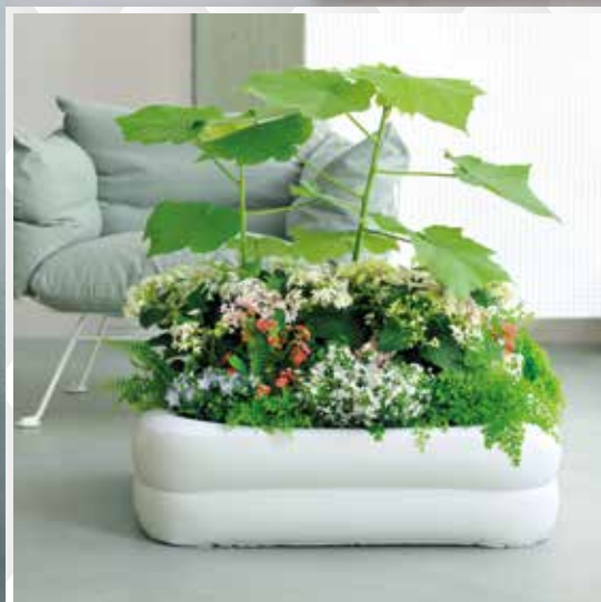
Des formes gonflables dans l'esprit chambre à air tout confort