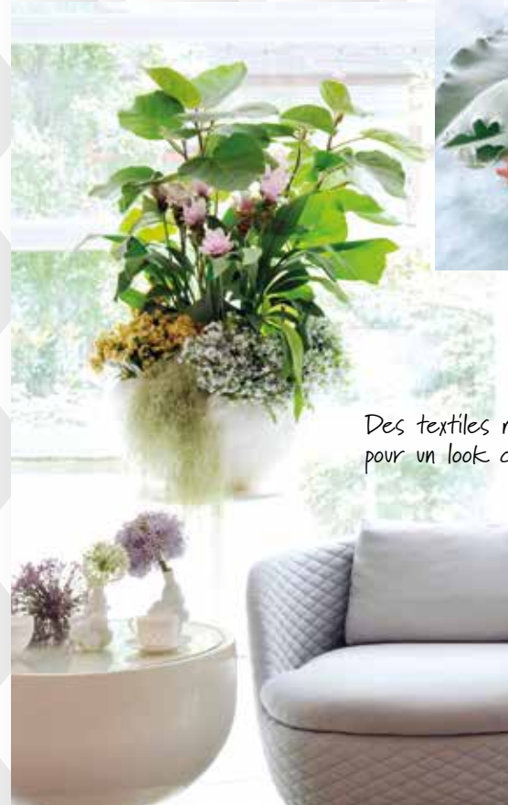
Des textiles matelassés pour un look confortable