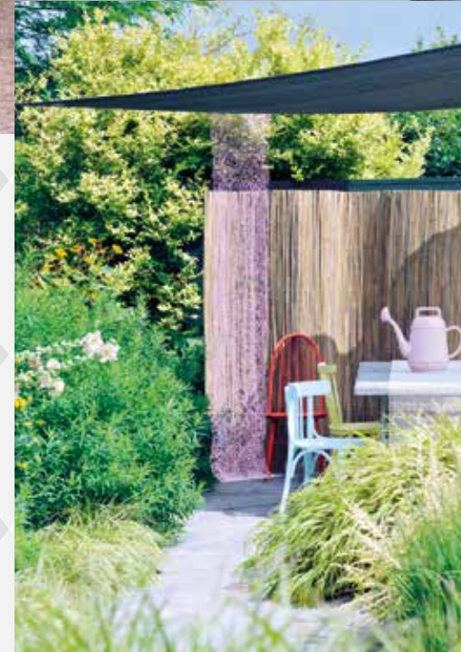
Des matériaux semi-transparentes renforcent le sentiment de douceur