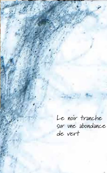
Le noir tranche sur une abondance de vert