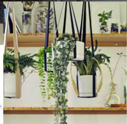
Des formes et des motifs irréguliers