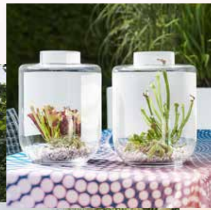
Spannend spel tussen transparant en semi-transparant