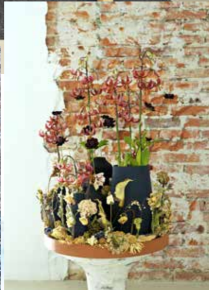
Droogbloemen terug van weg geweest