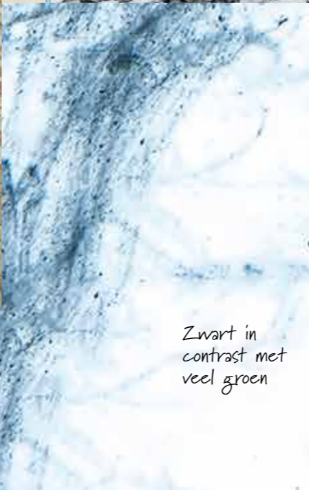
Zwart in contrast met veel groen