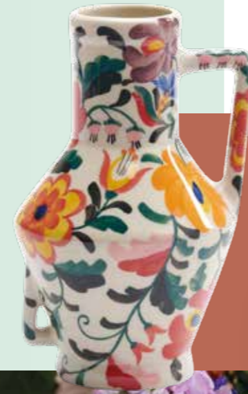
De belangrijkste inspiratie voor de dessins zijn de jaren '70 of folklore