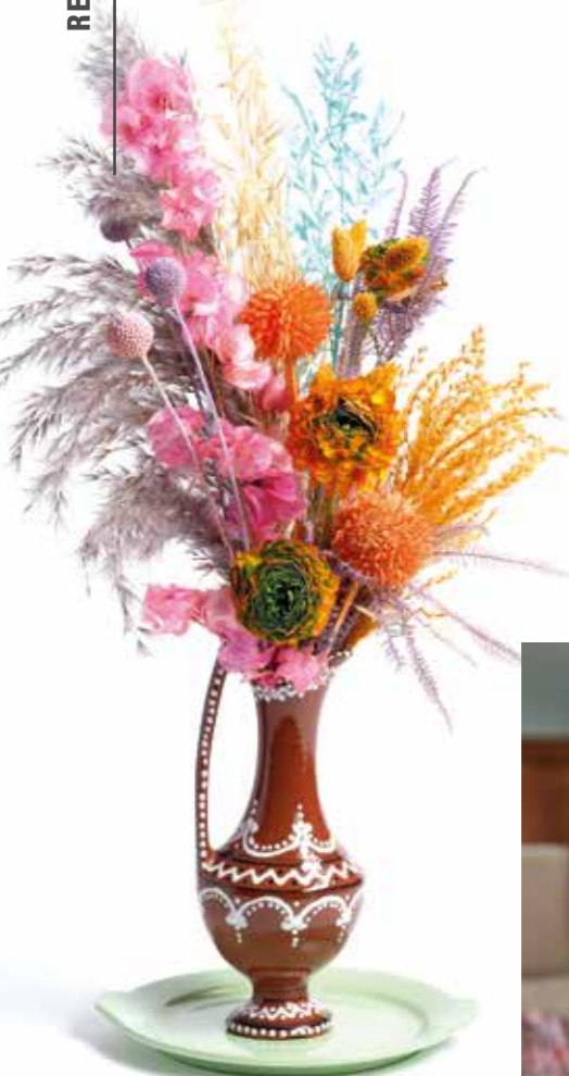
Droogbloemen zijn nog steeds van toepassing, maar hebben zeker niet de overhand